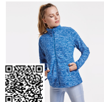
ARTIC WOMAN CQ6413