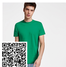
ATOMIC 150 CA6424