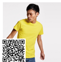
DOGO PREMIUM CA6502