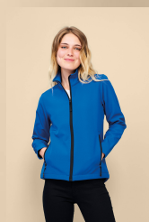
RACE WOMEN 01194