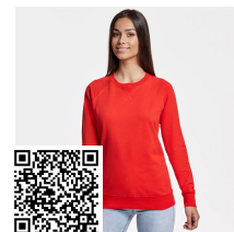
ANNAPURNA WOMAN SU1111