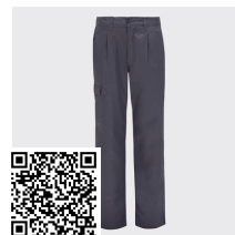
DAILY NEXT PA9200