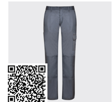
DAILY WOMAN PA9118