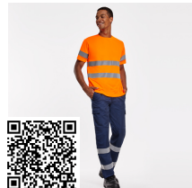
DAILY HV HV9307