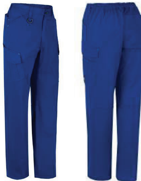
C.09 Gris C.11 Azulina C.57 Marino