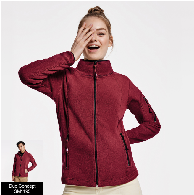
Duo Concept SM1195