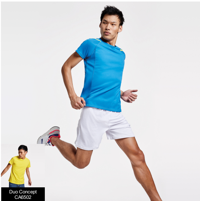
Duo Concept CA6502