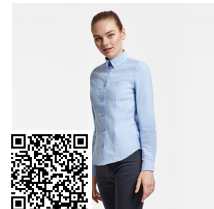
OXFORD WOMAN CM5068