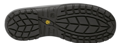
Suela Antiestática + Resistente a los hidrocarburos