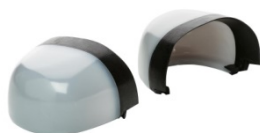
Puntera no metálica