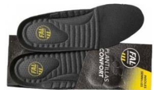
Plantillas extraíbles. Lavables