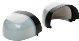
Puntera no metálica