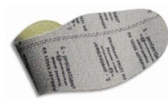
Plantilla anti-perforación flexible