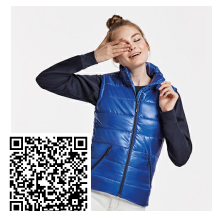
MONTANA WOMAN RA5084